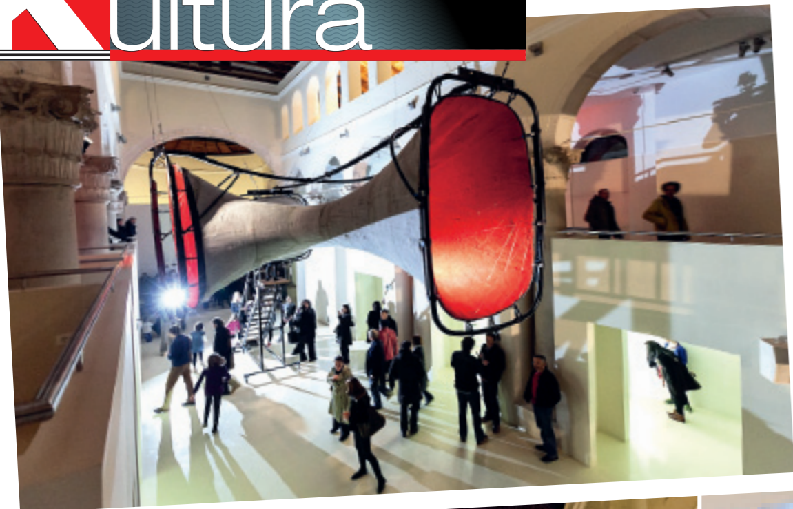
Posljednja izložba Numen/ For Use 'Introvertura' u Muzejsko-galerijskom prostoru u Puli (gore), kojoj je prethodila izložba golemog Apoksiomena Ante Rašića

U Puli su otvorene dvije nove kulturno-turističke atrakcije, Muzejsko-galerijski prostor Sveta Srca i podzemni tunel Zerostrasse, izgrađen u doba Austro-Ugarske Monarhije