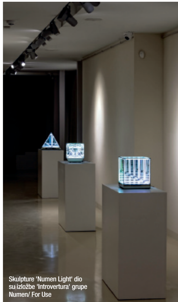
Skulpture 'Numen Light' dio su izložbe 'Introvertura' grupe Numen/ For Use

1995. obnovljen urušeni krov i sanirana apsida koja se počela odvajati od ostatka građevine. Godine 2007. započet je veliki projekt obnove u srednjovjekovni lapidarij, ali je na kraju ipak odlučeno da postane multifunkcionalan prostor za postavljanje klasičnih muzeoloških izložbi u vitrinama, galerijskih izložbi, slobodnih instalacija u prostoru te za održavanje predavanja i koncerata“, kaže Darko Komen.